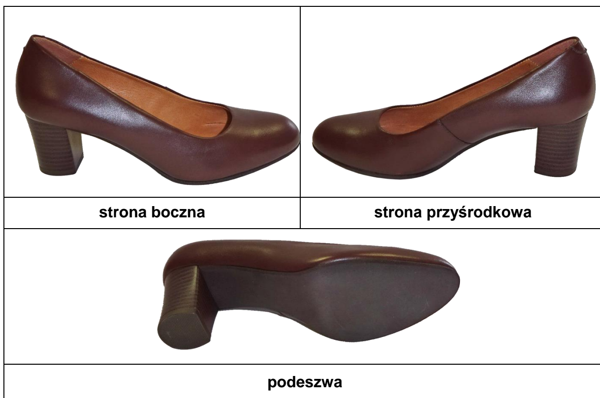
Fot.1 Wzór czółenek damskich do munduru wyjściowego